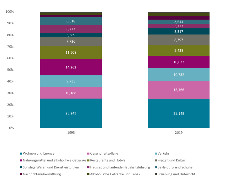
Abbildung 3: Die Verschiebung der Warenkorbstruktur des LIKs

Der Gesundheitssektor entwickelt sich zu einem immer wichtigeren Zweig der Schweizer Wirtschaft. Im Jahr 2017 waren im Gesundheitswesen 281 590 Personen tätig (gerechnet in Vollzeitäquivalenten). Der Anteil der Beschäftigten im Gesundheitswesen an der Gesamtbeschäftigung nimmt langfristig betrachtet zu. Er erhöhte sich, gemessen in Vollzeitäquivalenten, von 4.8% im Jahr 1992 auf 7.3% im Jahr 2017. Der Anteil des Gesundheitswesens an der gesamten Wertschöpfung stieg von 3.9% (1997) auf 7.3% (2017).