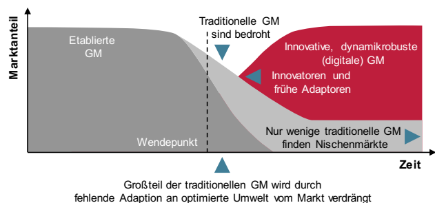
Abb.3 nach Bughin et al. 2018

Die fehlende Anpassungsfähigkeit führt zur Verdrängung traditioneller GM, wie die folgende Abbildung 3 illustriert. Aktuell sind es digitale GM, die sich dynamikrobust zeigen und daher durchsetzen können.