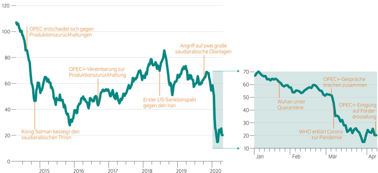
Abbildung 1: Ölpreisentwicklung In Dollar pro Fass Brent-Rohöl

Der Erdölmarkt ist aktuell aufgrund eines der drastischsten Preiseinbrüche der Marktgeschichte wieder einmal im Fokus. Parallel zu den Finanzmarkturbulenzen hat sich der Ölmarkt 2020 zunehmend destabilisiert – ein Preiseinbruch von etwa 70 Prozent setzt Ölproduzenten zunehmend unter Druck. Zuletzt konnten sogar negative Preise für einzelne Ölsorten beobachtet werden.