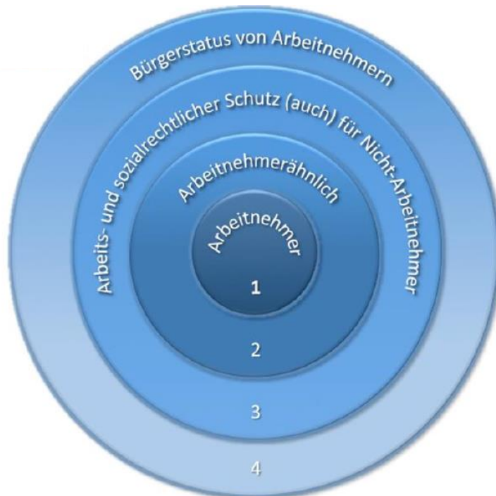
Abbildung 3: Darstellung des 4-Ringe-Modells des sozialen Schutzes von Arbeit nach Mückenberger