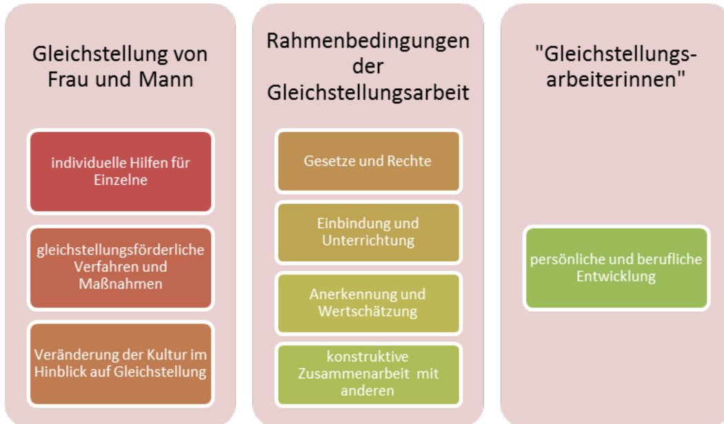
Abbildung 1: Dimensionen des Erfolgs bzw. Misserfolgs der Gleichstellungsarbeit