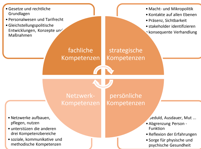
Abbildung 3: Kompetenzen für die Gleichstellungsarbeit