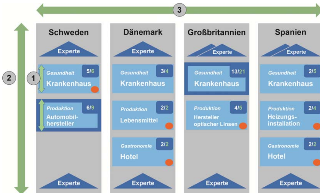
Abbildung 2.: Darstellung der Auswertungsstrategie

Die Ebene der betrieblichen Fallstudien dient vorrangig dazu, das konkrete Vorgehen (das Wie? ) beispielhaft und prozesshaft nachzuzeichnen und das Zusammenspiel von relevanten Rahmenbedingungen mit der betrieblichen Ebene zu erklären. Es ist jedoch nicht der Anspruch der Fallstudien, Aussagen über die Repräsentativität der beobachteten Phänomene im