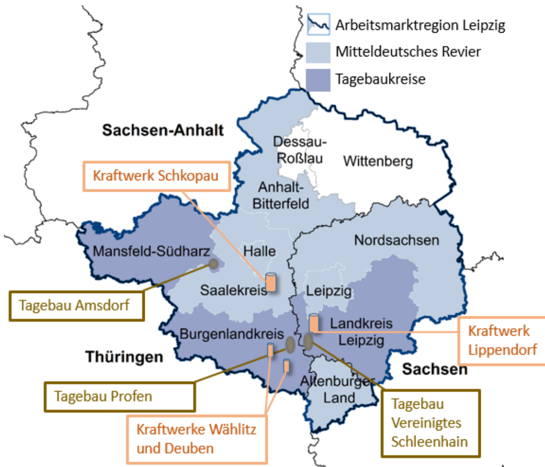
Abbildung 1: Lage des Mitteldeutschen Reviers in der Arbeitsmarktregion Leipzig