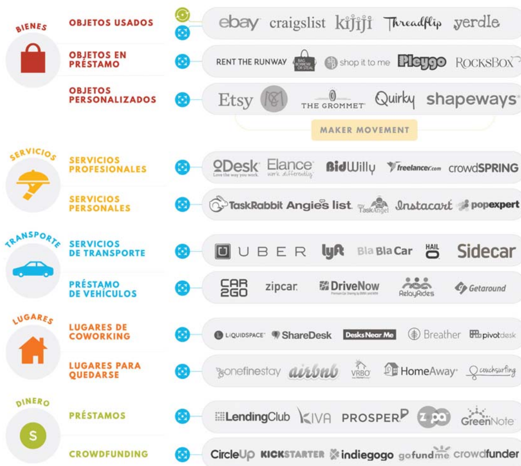
Ilustración 1. Taxonomía de la economía compartida

El consumo colaborativo abarca diferentes bienes y servicios, tales como, viajes y transporte (AirBnB, Lyft), moda y alimentación (GirlMeetsDress, Cookisto), préstamos entre iguales (Zopa, Prosper), intercambio de habilidades y conocimientos (TaskRabbit, Zaarly, Quora), entre otros (Ilustración 1).