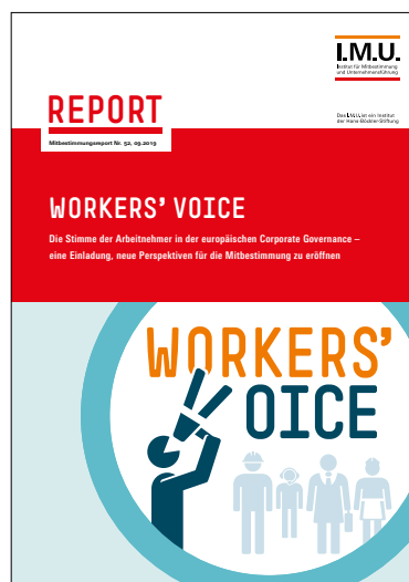
Die Stimme der Arbeitnehmer in der europäischen Corporate Governance – eine Einladung, neue Perspektiven für die Mitbestimmung zu eröffnen. Reihe: Mitbestimmungsreport, Nr. 52. Düsseldorf: 2019, ISSN: 2364-0413