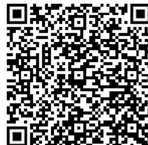
Abbildung 1 1-D Barcode (oben) - 2-D Barcode (unten)