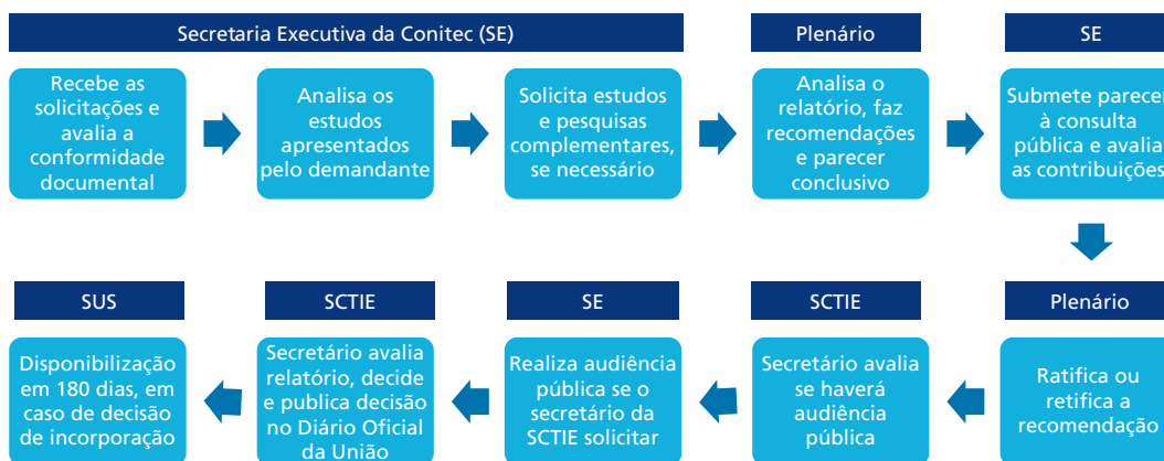
FIGURA 1 Fluxo da avaliação de tecnologias pela Conitec