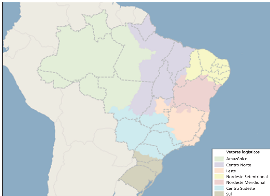
FIGURA 2 Vetores logísticos definidos na pesquisa de embarcadores da EPL