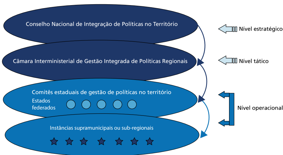
FIGURA 2 SGDR proposto

deliberativo, competiria, entre outras atribuições, articular a regionalização de políticas e planos setoriais federais, através de uma carteira de projetos e de um pacto de metas interministerial, organizada por câmara interministerial” (Brasil 2015). Além disso, caberia recomendar a regionalização dos instrumentos de planejamento e orçamento federal e estaduais, articulando programas governamentais estaduais, organizados por comitês. O SGDR teria o desenho explicitado na figura 2, com os níveis estratégico, tático e operacional.