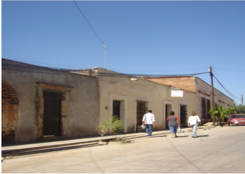
Una calle típica en el barrio mexicano.