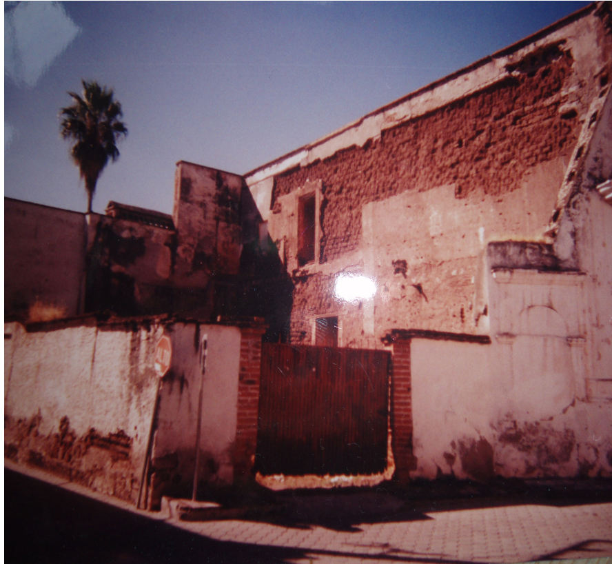
En los cincuenta la mayoría de las casas en el centro solo tenía la fachada.

Cuando Alcorn llegó al Pueblo encontró una localidad poco menos que abandonada. Las casas de la zona central estaban prácticamente en ruinas (Navarro 1988).