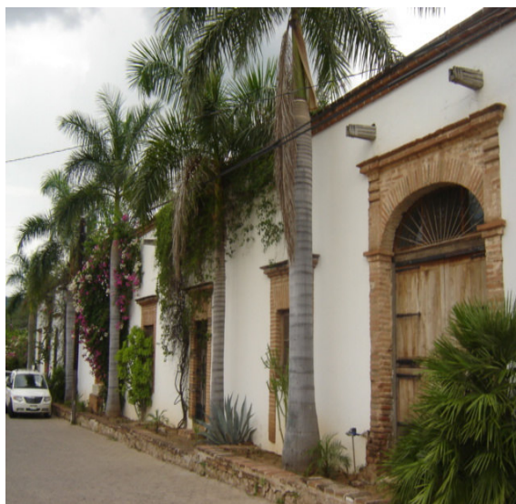
Una calle característica en el barrio de los norteamericanos.

La gente migra por distintas razones y con diferentes recursos accesibles. En esta línea Pries (2004) distingue cinco tipos ideales de migrantes a partir de criterios sobre migración y la duración del fenómeno en el tiempo.