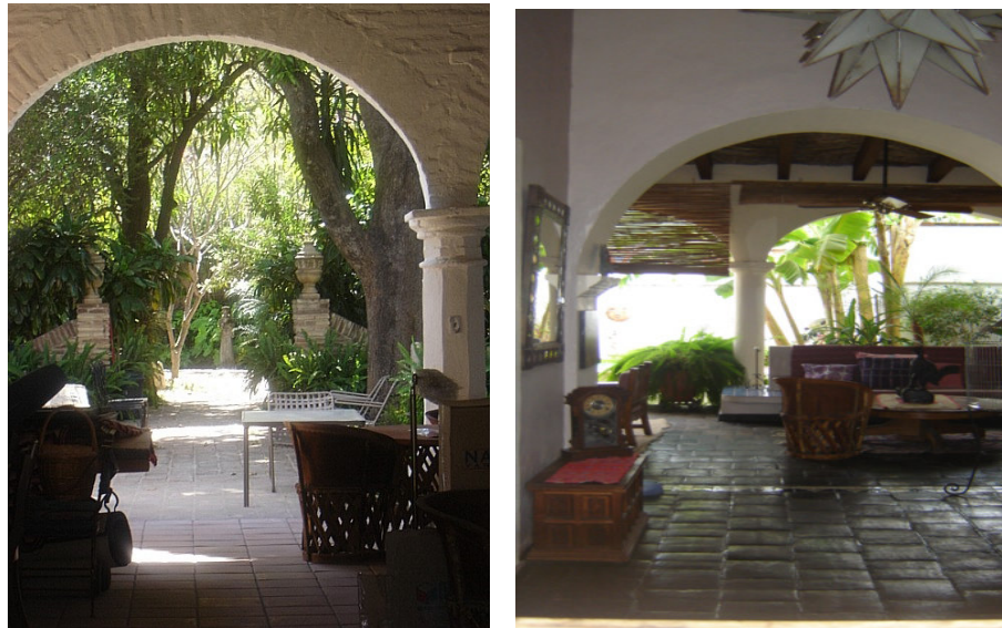
Patios de las mansiones rescatadas por los inmigrantes norteamericanos

de estas personas el Pueblo, al punto de que decidían dejar su país para vivir ahí?, ¿Qué buscan estos inmigrantes? Y finalmente al ver los contrastes entre las zonas del Pueblo ¿Cómo influía la presencia de este grupo de norteamericanos en la vida cotidiana del Pueblo?