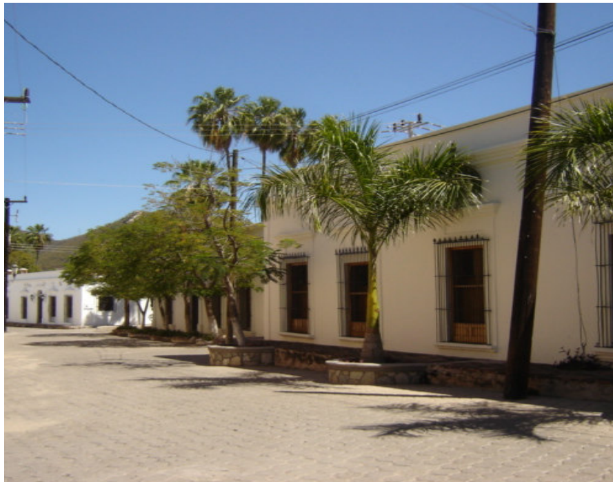
Una calle en el barrio de los inmigrantes norteamericanos en el centro con la arquitectura que reflejan parte del sueño México auténtico.

Estos valores representan y forman partes de la construcción de una nueva identidad imaginada y re-territorializada de la comunidad de los inmigrantes norteamericanos que se ha transformado por la experiencia migratoria. La búsqueda de realizar el sueño mexicano gracias a la presencia en el Pueblo de determinadas características. A pesar de la re-territorialización, conservan la nacionalidad como un identificador interno y externo primordial para la conformación de esta colectividad particular.