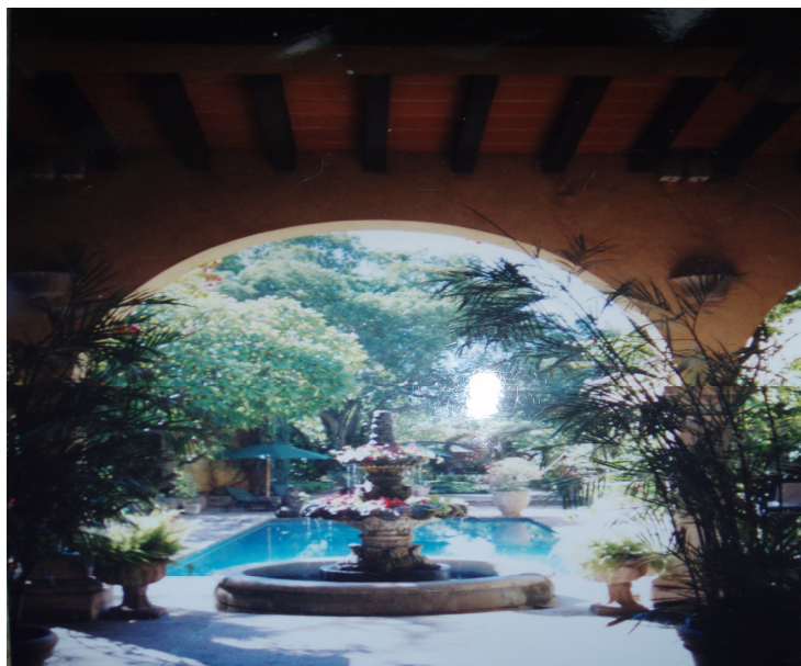
Patio en una de las casas de los norteamericanos.

Es importante notar que esta idealización sobre lo mexicano fue construida en los Estados Unidos, pero no podía ser realizada allí sino únicamente en ciertos lugares de México (Clausen 2008). Por ejemplo, lugares donde ahora se ubican comunidades de inmigrantes norteamericanos como San Miguel Allende, en el Estado de Guanajuato y en Guadalajara, en el Estado de Jalisco (Howells y Merwin 2005) reúnen, al igual que el Pueblo que estudiamos, características que son percibidas por los inmigrantes como una especie de paraíso perdido de lo mexicano auténtico y, que es una razón importante para explicar esta migración. Es decir, que junto a los elementos de racionalidad económica que sustentan esta migración, ocupan un papel esencial elementos como la comodidad material, la tranquilidad, una búsqueda de ciertos paisajes y construcciones, tipo coloniales, que coincidan con esta imagen sobre lo mexicano auténtico. En este caso de estudio el Pueblo está ubicado al pie de montañas fértiles, tiene un clima agradable y sólo una carretera va hacia él. El centro del Pueblo y los barrios de la comunidad norteamericana tienen calles de terrecería con palmeras, y las casas son restauradas en el estilo colonial; los patios y jardines con árboles de frutas y flores exóticas (para los norteamericanos), fuentes de agua adornadas y recámaras con azulejos. Las casas tienen una buscada imagen de privacidad y exclusividad 32 .