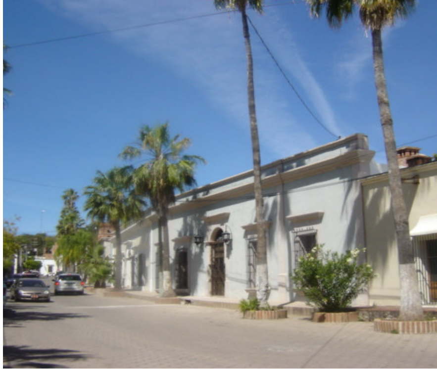
Una calle típica en el barrio de inmigrantes norteamericanos.