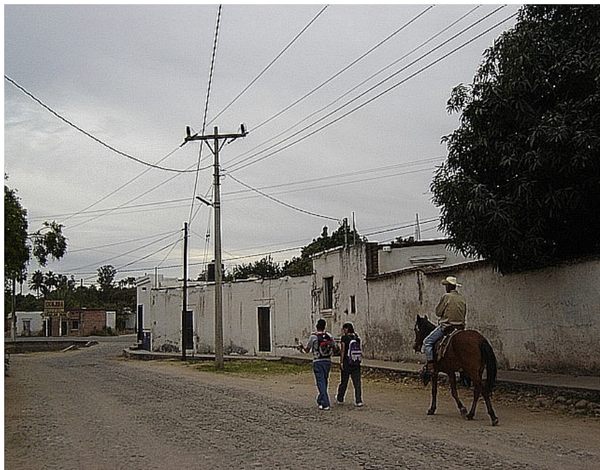
La calle principal en los barrios donde viven los mexicanos.