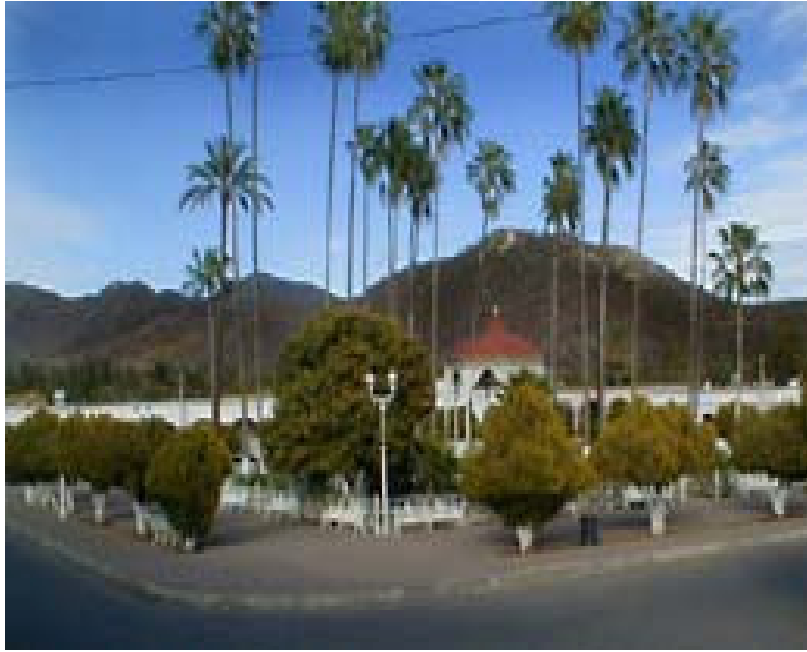
La plaza central.