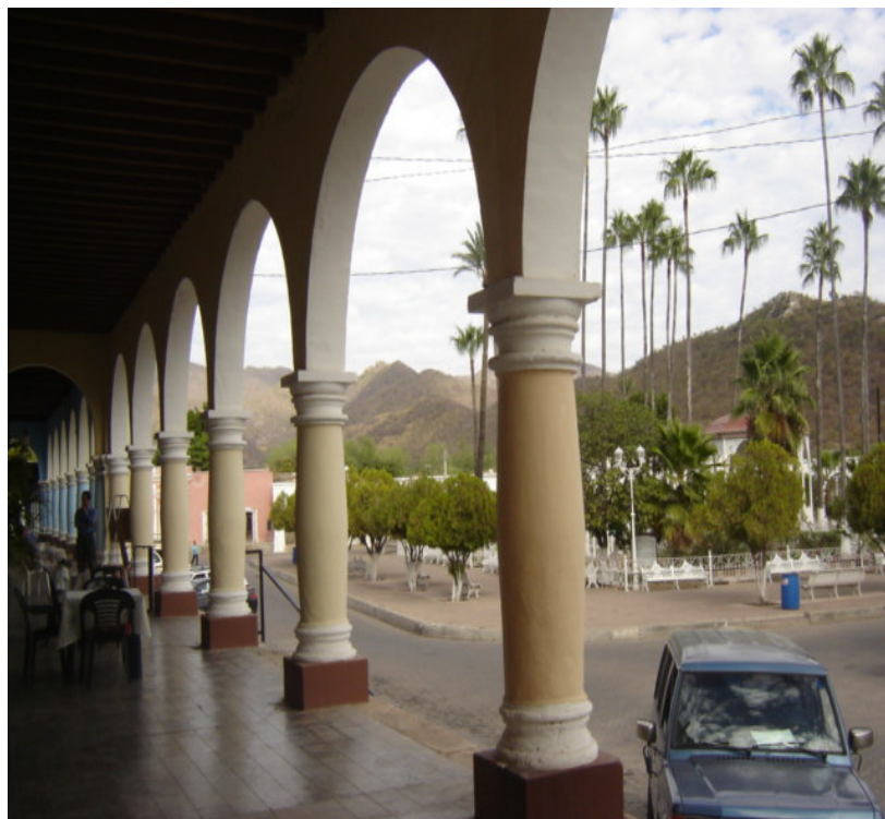
La plaza central