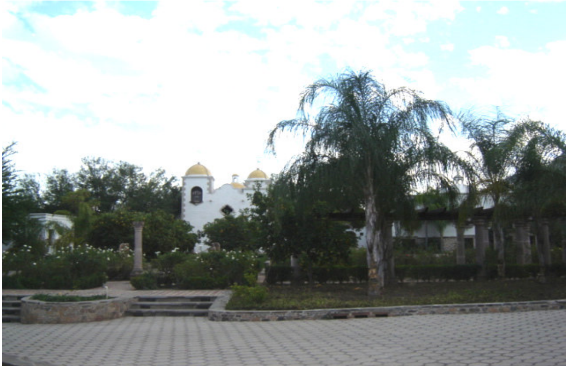
Una mansión rescatada, propiedad de inmigrantes norteamericanos.

La reconstrucción de las casas hecha por los inmigrantes, no intentaba copiar o preservar exactamente del estilo original de las construcciones, sino más bien conformar un estilo colonial mexicano que corresponde a la imagen idealizada que ellos tienen (Clausen 2008). Esto también se debe a razones prácticas; en el momento en que Alcorn llega al Pueblo sólo quedaban en pie las fachadas de las viejas residencias coloniales, además de que no existían planos o fotos que permitieran una reconstrucción exacta. Es posible reconocer en el estilo de la mayoría de las casas una influencia francesa combinada con motivos moros que surgieron en España. Este Pueblo es el único lugar en el Estado de Sonora que rescató y conservó su centro histórico, en gran parte gracias a los recursos e interés de los inmigrantes estadounidenses.