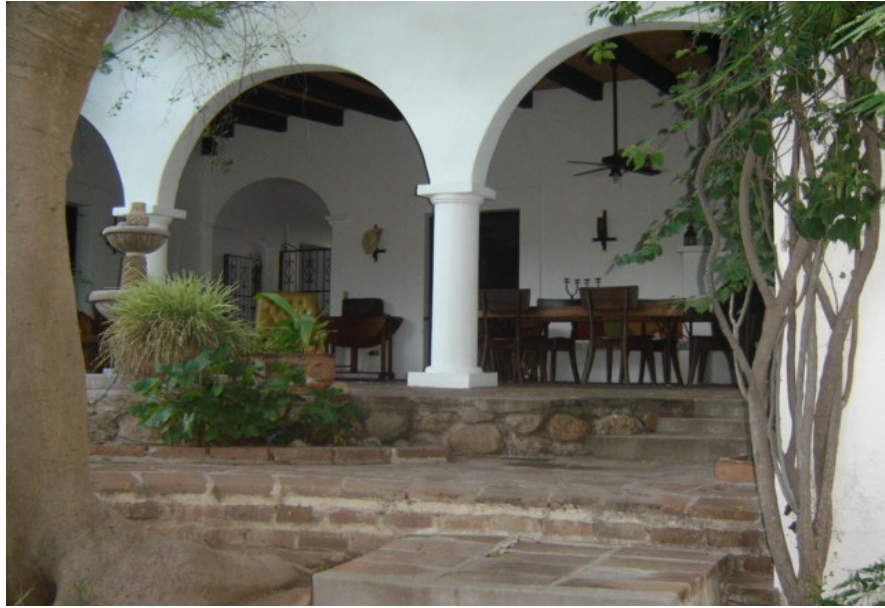
Un patio típico en una casa de los inmigrantes norteamericanos. Las columnas y arcos representan exclusividad para los inmigrantes.

Un aspecto vinculado íntimamente con elementos arquitectónicos es su búsqueda por preservar el Pueblo, en su parte central al menos, con un estilo colonial que corresponda a su imagen del México auténtico. Esto hace que para ellos sea inaceptable la apertura de tiendas transnacionales como “Seven-Eleven” o “Wal-Mart”. Estas representarían para ellos el inicio de una “pequeña Norteamérica”, cosa que no les interesa. Tampoco quieren regresar a los Estados Unidos a construir allí una versión de México (Clausen 2008). El viaje y la distancia es parte del imaginario que construye su nueva condición e identidad (Entrevista, 1; Entrevista, 34).