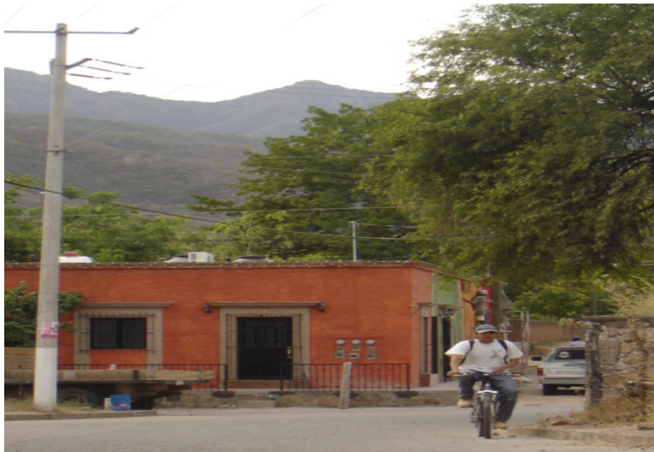
Una calle que forma uno de los límites espaciales entre el barrio de los mexicanos (el muro a la derecha de la foto) y de los inmigrantes norteamericanos (las casas a la izquierda de la foto).