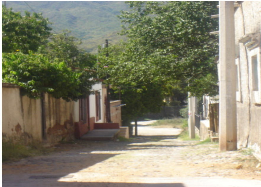
Una calle característica en el barrio donde viven los mexicanos