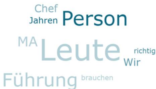
Abbildung 3: Wortwolke zur Sozialkompetenz «Führung»

Eine visuelle Darstellung der Schlüsselbegriffe aus den zehn Interviews in Bezug auf die Kompetenz «Führung» findet sich in der nachfolgenden Abbildung 3.