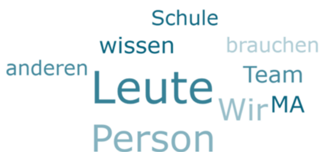
Abbildung 4: Wortwolke zur Sozialkompetenz «Teamwork»