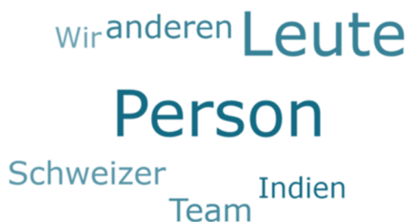
Abbildung 5: Wortwolke zur Sozialkompetenz «Arbeiten im interkulturellen Kontext»

Direkte/r Vorgesetzte/r, Grossfirma, Verarbeitendes Gewerbe, Herstellung von Waren