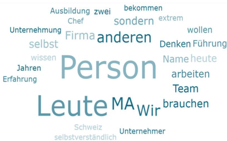
Abbildung 2: Wortwolke zu allgemeinen Selbst- und Sozialkompetenzen