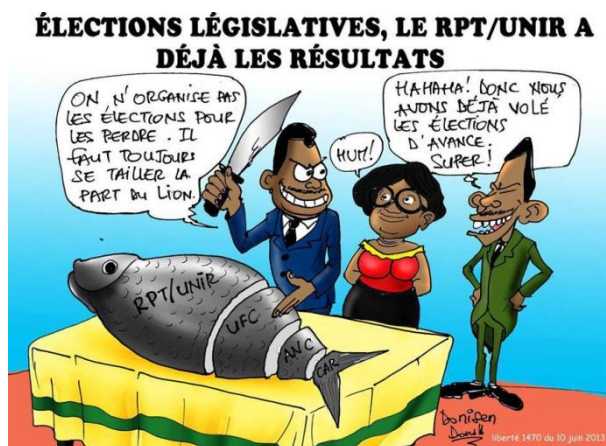
Togo – l'élections législatives de 2018

Source: Aklassou-Gana Kossi, alias Donisen Donald , caricaturiste du Togo