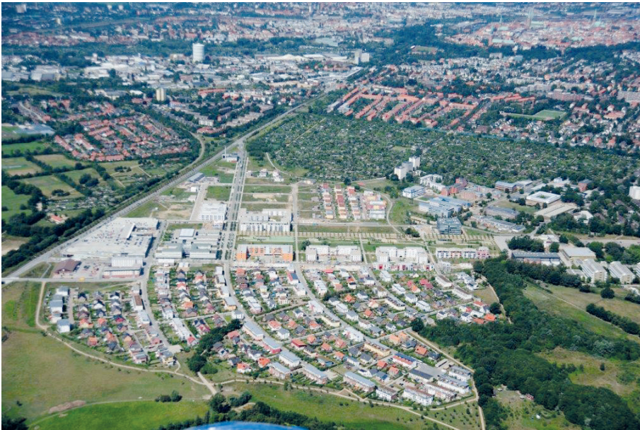
Abbildung 4: Luftbild des Hochschulstadtteils (2009)

die Erwartungen an den Wohnstandort im Großen und Ganzen als erfüllt angesehen werden. Die Umzugsneigung fällt ebenfalls sehr gering aus. Demgegenüber wurden jedoch gerade prägnante Elemente des urbanen Wohnens negativ bewertet, das urbane Wohnumfeld nicht in seiner Gesamtheit akzeptiert: Bedarfe an Freiraum und ruhiger Umgebung werden beispielsweise als nur unzureichend erfüllt angesehen und die bauliche Dichte wird als negativ empfunden. In diesem Zusammenhang wird explizit auf die Blockrandbebauung (überwiegend preisgebundener Wohnraum) am Park verwiesen und die Befürchtung sozialer Degradierung formuliert. Städtische Lebensweisen wie Toleranz und Offenheit sind demgegenüber nicht vorzufinden, sondern im Gegenteil Bestrebungen der Bewohner des Eigenheimgebietes zur Distinktion von sozial schwächeren Gruppen. Das Potenzial für eine gesunde soziale Durchmischung wird daher von der Autorin als begrenzt eingeschätzt. Es bestehe vielmehr die Gefahr, dass sich das untersuchte Einfamilienhausgebiet zu einer „nachbarschaftlich isolierten Eigenheimsiedlung“ entwickelt und somit vom restlichen Stadtteil abkoppelt. Die Autorin der Arbeit schlussfolgert, dass zwar bauliche Konstruktionen des Urbanen und in Ansätzen auch eine Nutzungsmischung umgesetzt werden konnten, eine städtische Gesellschaft und damit verbundene Wohnpräferenzen jedoch nicht vorzufinden sind (Kühl 2009).