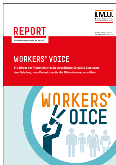
Die Stimme der Arbeitnehmer in der europäischen Corporate Governance – eine Einladung, neue Perspektiven für die Mitbestimmung zu eröffnen. Reihe: Mitbestimmungsreport, Nr. 52. Düsseldorf: 2019, ISSN: 2364-0413