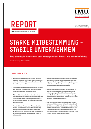
Starke Mitbestimmung – Stabile Unternehmen. Eine Empirische Analyse vor dem Hintergrund der Finanz- und Wirtschaftskrise. Reihe: Mitbestimmungsreport, Nr. 51. Düsseldorf: 2019, ISSN: 2364-0413