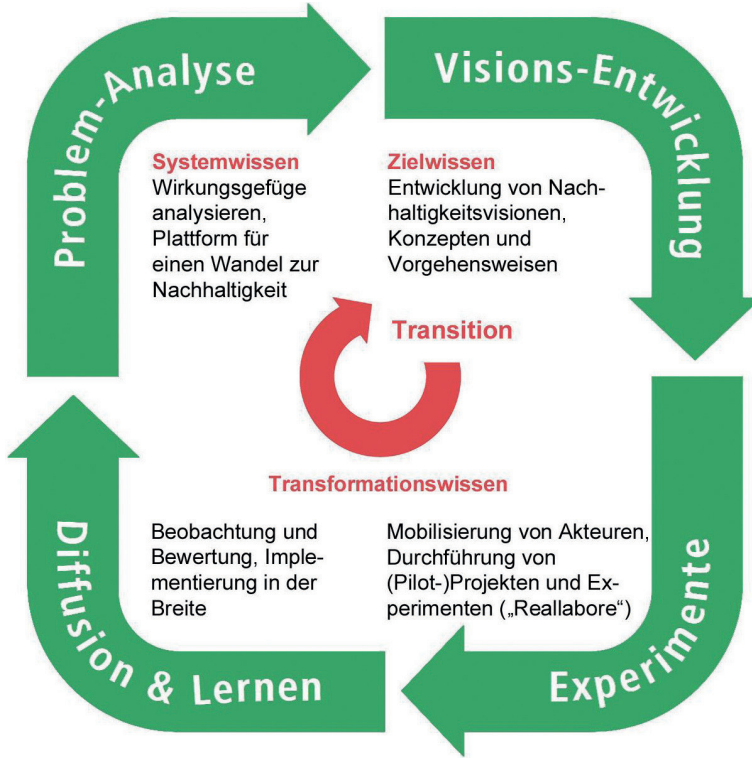
Abb. 2: Transition-Zyklus / Quelle: Meyer 2018b: 27 nach Brüggemeier/Scheck/Schepelmann et al. 2012: 31; Loorbach 2010: 173; Singer-Brodowski/Schneidewind 2014: 135

Für die akademische Lehre/Bildung heben Wiek, Withycombe und Redman (2011) fünf Schlüsselkompetenzen hervor: die Kompetenz zum systemischen Denken, zum strategischen Denken und Handeln, zur interpersonellen Zusammenarbeit sowie die antizipatorische und die normative Kompetenz. In methodischer Hinsicht wird besonders das Lernen durch Ausprobieren und reflexives Lernen als bedeutsam erachtet (Michelsen/Adomßent 2014: 44 mit Verweis auf Martens 2006, Kemp/Martens 2007). Mit Blick auf eine transformative Wissenschaft weisen Schneidewind und Singer-Brodowski (2013) zudem darauf hin, dass es auch im universitären Bereich neben der Vermittlung von Systemwissen stärker um das Erlernen von Ziel- und Transformationswissen gehen sollte (mit Bezug auf die Bedeutung von Reallaboren z.B. Singer-Brodowski/Beecroft/Parodi 2018). Im Zusammenhang mit Zielwissen ist vor allem das Paradigma des Wirtschaftswachstums (SDG 8) diskussionswürdig, worauf kritische Ökonomen bereits seit Ende der 1960er / Anfang der 1970er Jahren hingewiesen haben (Boulding 1966; Daly 1996) und im Zuge des Nachhaltigkeitsleitbildes gegenwärtig um Ansätze zu „Postwachstum“ (Paech 2005; Seidl/Zahrnt 2010) und „Degrowth“ 7 erweitern. Noch heute, mehr als 40 Jahre nach den „Grenzen des Wachstums“