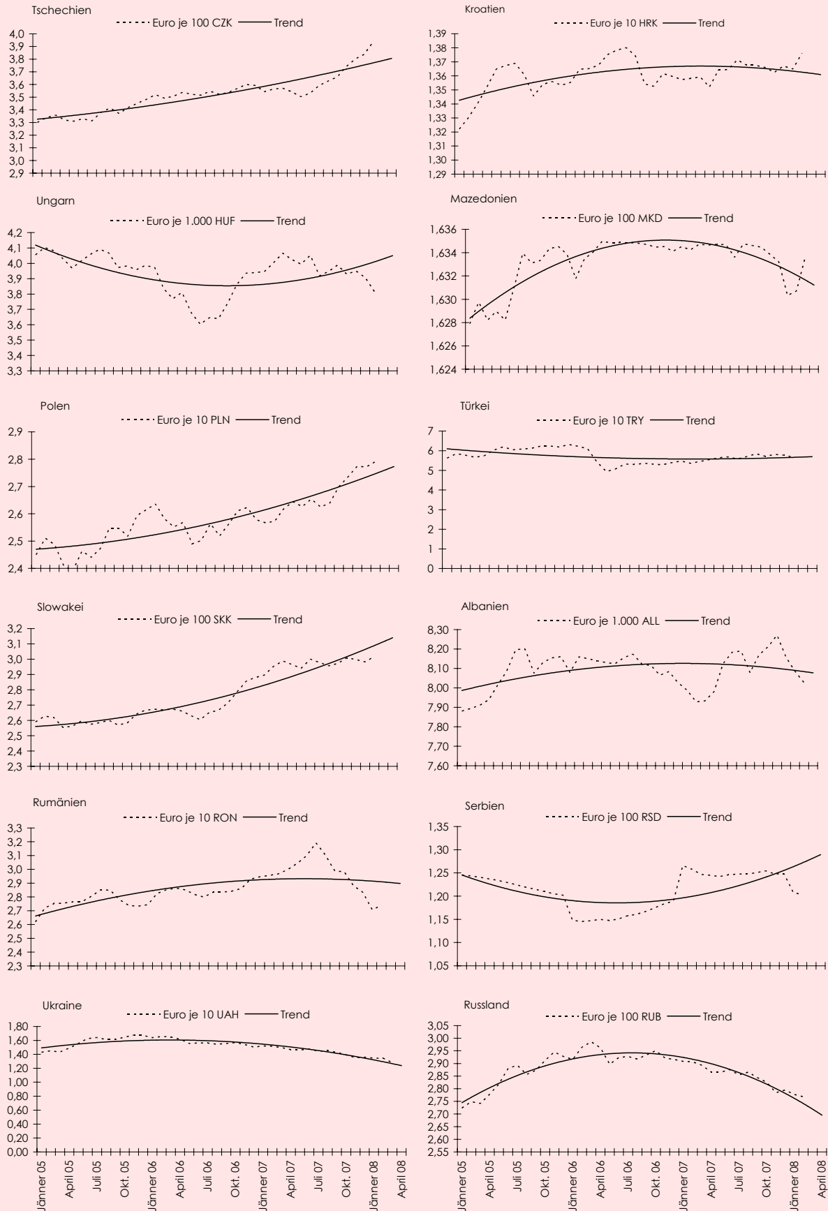
Abbildung 1: Nominelle Wechselkurse

Q: wiiw-Monatsdatenbank basierend auf nationalen Statistiken.