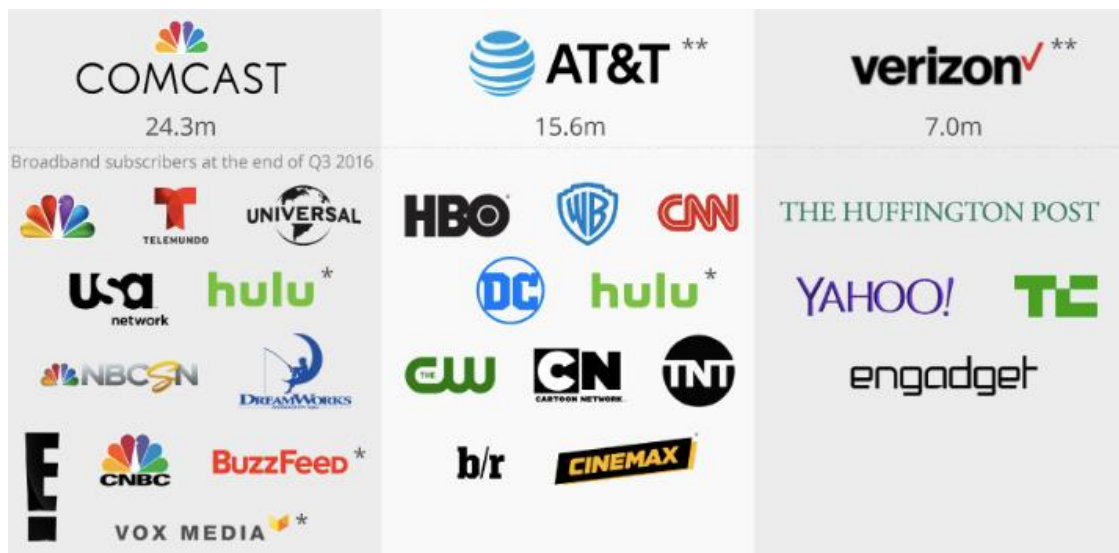
Figura 2: Este cuadro muestra los proveedores / marcas de contenidos que pertenecen a proveedores de servicio de acceso a Internet en los Estados Unidos. Fuente: Statista 9