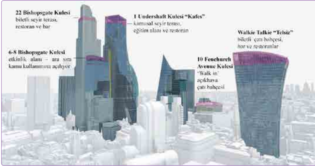
Şekil 3. Londra Square Mile Bölgesi'ndeki Kulelerin Gökyüzü Bahçeleri. 46

koşuluyla onadığı düşünülürse, tam bir hayal kırıklığı olmaktadır 45 (Şekil 3).