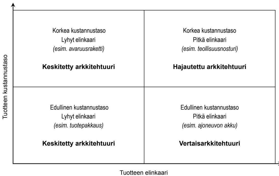
Kuvio 2 Verkostoarkkitehtuurien soveltuvuus erilaisiin tuotantotilanteisiin