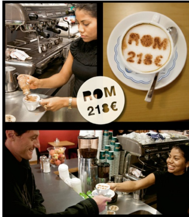
Abbildung 3: Emotionen und Vernunft ansprechen