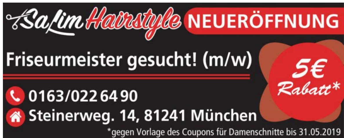
Abbildung 4: Anreiz Coupon

Guerilla Marketing spielt sehr viel mit Spontaneität und kann schnell als "Effekthascherei" abgetan werden. In der heutigen Zeit werden die Menschen durch soziale Medien und die intensive Nutzung des Smartphones nahezu ständig mit Eindrücken versorgt. Daher sollte eine erfolgreiche Guerilla-Taktik für den Kunden auch einen Nutzen darstellen und nicht nur deren Aufmerksamkeit erregen. 19 Um für den Kunden einen solchen Nutzen zu generieren, der ihn dazu anregt für das beworbene Produkt oder die Dienstleistung zu bezahlen, muss das Unternehmen verstehen, was der Kunde will. 20 Ein Anreiz hierfür kann beispielsweise eine Coupon-Aktion sein.