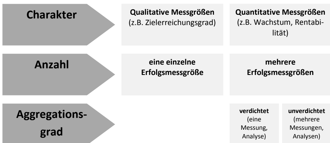
Abbildung 1: Möglichkeiten zur Messung des Erfolgs

Die Definition von Erfolgsgrößen legt den Grundstein für die Erfolgsfaktorenforschung, denn ohne vergleichbare Erfolgsmessgrößen, kann nicht bestimmt werden, ob ein Faktor zum Unternehmenserfolg beiträgt oder nicht. Wie aus Abbildung 1 ersichtlich, wird zwischen quantitativen (z.B. Profitabilität, Wachstum) und qualitativen (z.B. Wiederkaufsrate, Kundenzufriedenheit) Erfolgsgrößen unterschieden.