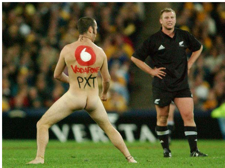
Abbildung 8: Rechtliche Konsequenzen

Wie bereits erwähnt können rechtliche Konsequenzen folgen, wenn sich nicht an gesetzliche Rahmenbedingungen gehalten wird. Bei Low-Budget-Aktionen ist dies weniger eine Gefahr, aber sollte jedoch bei einer Konzeption nicht vergessen werden.