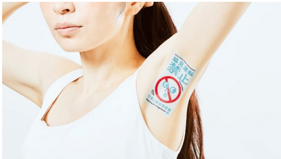
Abbildung 5: Abgrenzung zur Konkurrenz

Low Budget Guerilla Marketing wird vor allem von Start-Ups, kleinen und mittelständischen Unternehmen genutzt, deren Budget begrenzt ist. 21 Die Konkurrenz in diesem Umfeld ist zumeist sehr groß, daher ist es umso wichtiger, sich von der Konkurrenz abzuheben, um den Blick zum eigenen Unternehmen zu lenken. Dabei muss deutlich werden, was den Unterschied des eigenen Unternehmens zur Konkurrenz ausmacht.