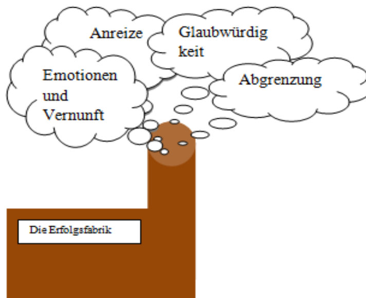
Abbildung 7: Die Erfolgsfabrik des Low Budget Guerilla Marketing

Für eine erfolgreiches Low Budget Guerilla Marketing konnten vier Faktoren herausgearbeitet werden, die zusammengefasst in Abbildung 7 visualisiert werden: