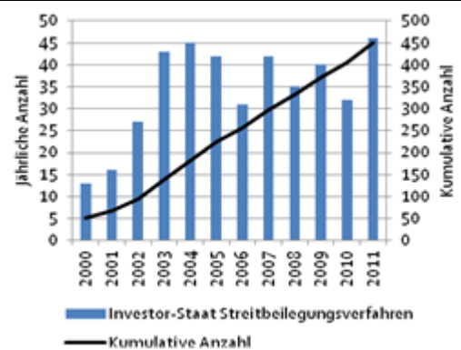
Abbildung 2: Anzahl Investor-Staat Streitbeilegungsverfahren 2000-2011

Quelle: Eigene Darstellungen basierend auf Daten von UNCTAD