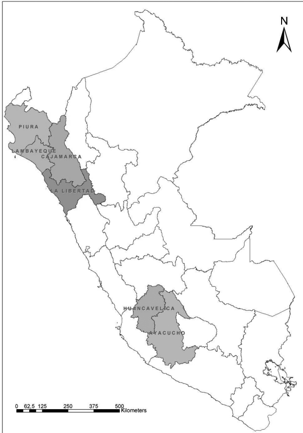
Cuadro 3.1: Regiones de intervención del FPA en la primera fase