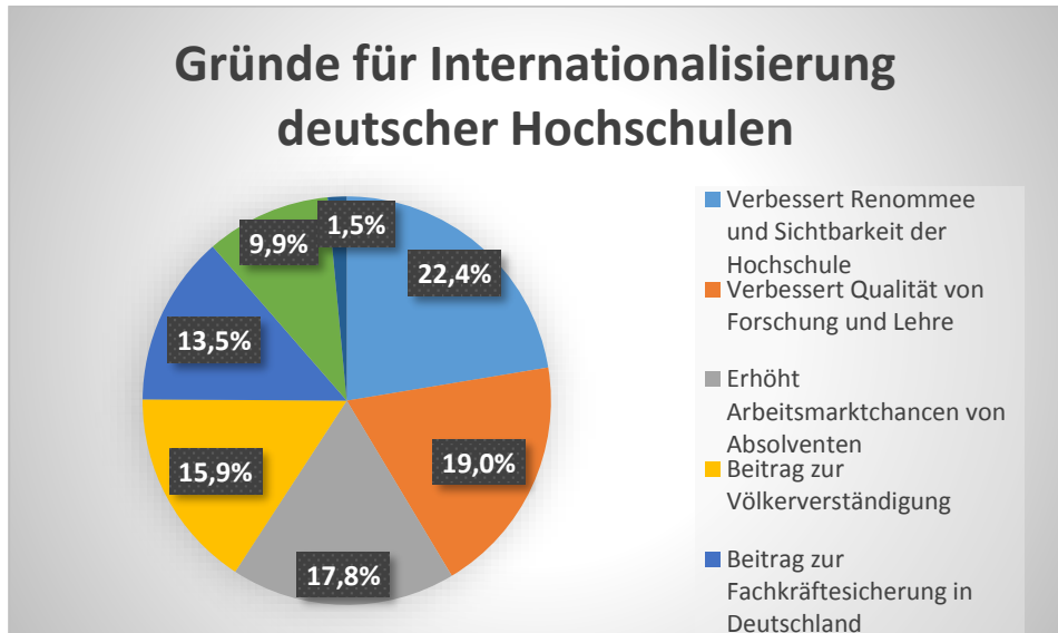
Abbildung 1: Gründe für die Internationalisierung an deutschen Hochschulen 9

Führt man die beiden Definitionen zusammen, ist Internationalisierung ein strategiegeleiteter langfristiger Prozess zur Steigerung der Internationalität einer Organisation. Mit diesem Prozess reagieren Hochschulen auf die zunehmende Globalisierung. Da der Prozess Lehre, Forschung und Verwaltung, d. h. alle wesentlichen Bereiche der Hochschule betrifft, kann Internationalisierung darüber hinaus als Querschnittsfunktion angesehen werden. 10