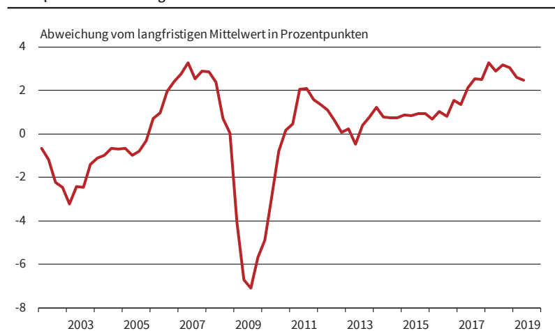
Abb. 2 ifo Kapazitätsauslastung der Gesamtwirtschaft