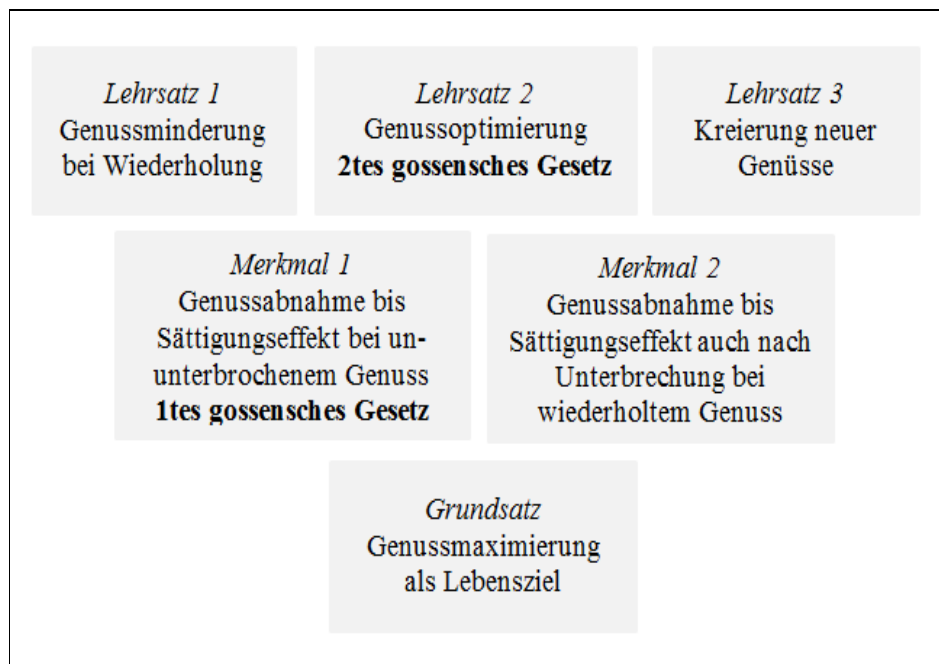
Abbildung 1: Die triadische Argumentationsstruktur Gossens mit den drei Charakteristika (Grundsatz, Merkmal, Lehrsatz) und sechs Argumenten dazu + die selektive Überlieferung zweier Argumente davon als Gesetze

Wie aus der Abbildung 1 deutlich wird, sind von den sechs Argumenten Gossens, die drei Charakteristika zuzuordnen sind, zwei Argumente übernommen worden, die in diesem Zuge beide zu „Gesetzen“ erklärt worden sind.