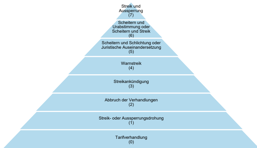
Abb. 1: Die Eskalationspyramide (Quelle: Lesch (2013a)).

In der ersten Eskalationsform berufen die Tarifparteien einen neutralen Schlichter, dessen Aufgabe darin besteht, eine weitere Eskalation durch trilaterale Verhandlungen zu vermeiden. Eine erfolgreiche Schlichtung beendet den Konflikt, ohne dass ein materieller Schaden auftritt. Die Konflikthandlung Scheitern und Schlichtung wird als fünfte Eskalationsstufe (und damit eine Stufe höher als der Warnstreik) bewertet, obwohl sie eine neue Friedenspflicht begründet. Es darf während der Schlichtung weder zum Streik aufgerufen werden, noch ein Warnstreik organisiert werden. Es wäre daher denkbar, die Eskalationsform Scheitern und Schlichtung zwischen dem Verhandlungsabbruch und dem Streikaufruf zu verorten. Gegen diese Überlegung spricht, dass die Gewerkschaften den Warnstreik als Druckmittel nutzen, um sich bilateral mit den Arbeitgebern zu einigen. Er ist nicht darauf angelegt, den Konflikt trilateral im Wege der Schlichtung zu lösen. Verhandlungstaktisch ist die Schlichtung dem Warnstreik demnach nachgelagert. Im Ablaufschema der Tarifverhandlung ist die Schlichtungsphase ebenfalls einem relativ späten Stadium zuzuordnen (Keller, 1985, S. 119). In der Regel finden Warnstreiks statt, bevor das Scheitern der Verhandlungen erklärt wird und ein Schlichtungsmechanismus greift. Der Warnstreik will ein Scheitern ja gerade verhindern. Daher stellt das Scheitern gegenüber dem Warnstreik auch dann eine Eskalationsverschärfung dar, wenn es mit einer Schlichtung verbunden ist.