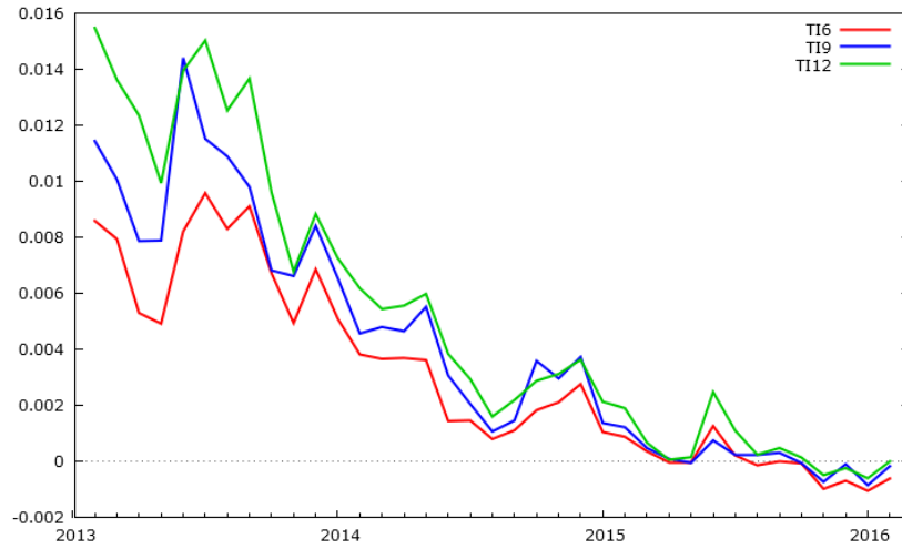
Figura 2: Tipos de interés medio de las letras del tesoro