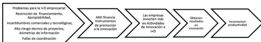
FIGURA 1 TEORÍA DE CAMBIO DE LOS PROGRAMAS DE FOMENTO A LA INNOVACIÓN DE ANII

Finalmente, es posible destacar que el mecanismo de financiamiento de la ANII a sus beneficiarios es mediante subsidios y créditos sobre la base de selección de proyectos que cumplen con ciertos criterios en relación con su novedad y mérito innovador. Esto difiere de otros instrumentos como los incentivos fiscales donde el proceso se basa en la autoselección de las firmas y la asignación de recursos es normalmente más automática y a posteriori . La selección directa de proyectos de innovación por parte de un agente público especializado tiene tres justificaciones. En primer lugar, el agente público actúa como un evaluador,