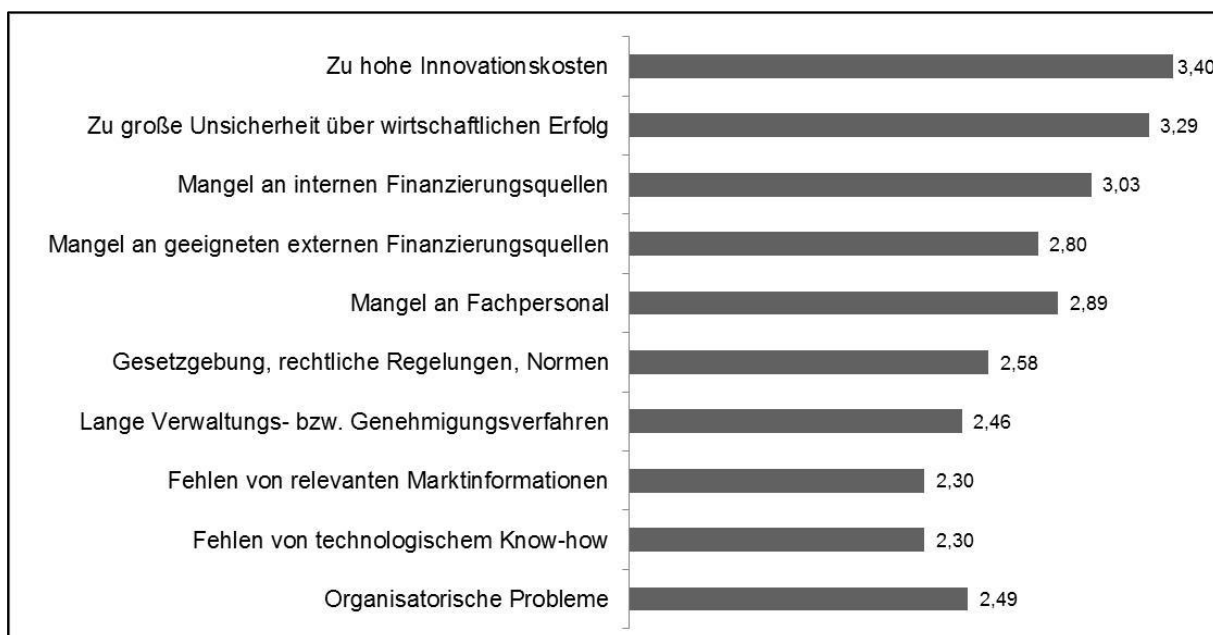
Abbildung 1: KMU und ihre Einschätzung von Innovationshemmnissen (Mittelwerte der Basisvariablen auf der Skala 1 = „keine“ bis 5 = „sehr hohe Bedeutung“)

Im Mittelpunkt steht ein Variablen­set, das anhand einer fünf­stufigen Skala Auskunft darüber gibt, inwiefern die in Abbildung 1 aufgeführten Hemmnisse für die aufgetre­tenen Innovationsprobleme eines KMU von Bedeutung gewesen sind. 26 Wie vermutet, sind Innovationshemmnisse aus KMU-Sicht stark auf Finanzierungsengpässe zurückzuführen. Mit einem Mittelwert von 3,03 findet sich ein Mangel an internen Finanzierungsquellen weit oben in der Bedeutungshierarchie. Im Durchschnitt gleich bedeutsam zu externen Finanzierungsrestriktionen bewerten jedoch die Befragten - zumindest für den Referenzzeitraum 2008-2010 - die Auswirkungen von Fachkräfteengpässen. Dies könnte unter Umständen ein Hinweis darauf sein, dass die Verknappung des Fachkräfteangebots tatsächlich bereits spürbar negative Auswirkungen auf die Innovationstätigkeit in KMU hat (vgl. Kapitel 1).