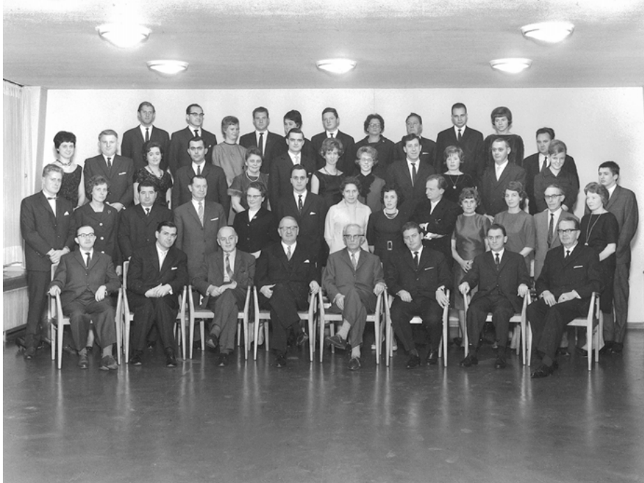
Abb. 8: Mitarbeitende 1962

auch eine laufende Strukturuntersuchung im Hinblick auf die Bedeutung der Montanindustrie an der Ruhr und in der Bundesrepublik insgesamt betrieben wurde: Angestrebt wurde also „eine Synthese zwischen der allgemeinen empirischen Konjunkturforschung und Konjunkturbeobachtung auf der einen Seite und der Erforschung der besonderen Probleme des rheinisch-westfälischen Industriegebietes und der Wirtschaftsbereiche Kohle und Stahl“ 165 auf der anderen Seite. Die Berichterstattung über den Kohlenbergbau und die Eisen verarbeitende Industrie wurde demgemäß innerhalb der Konjunkturberichte ausgebaut und diejenige über die allgemeine Konjunkturentwicklung „auf eine möglichst knappe Analyse der jeweiligen Lage konzentriert.“