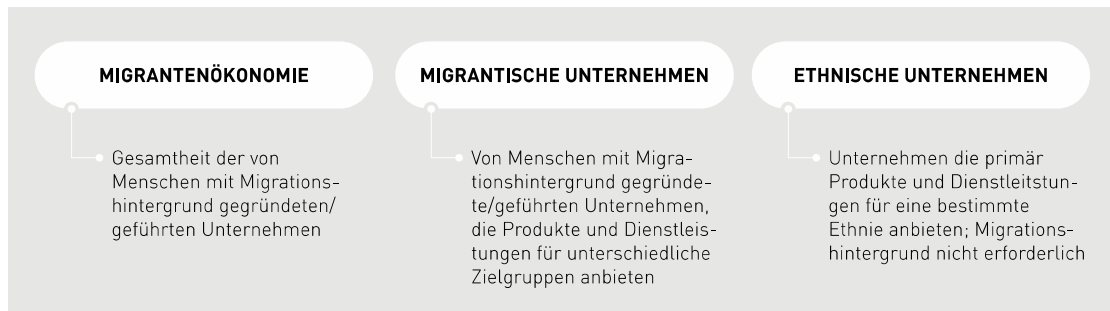
Abbildung 1. Begriffsverständnis

deutschen Pass), ihre Nachkommen sowie erst kürzlich Zugewanderte“ (iQ Fachstelle Migrantenökonomie, 2017: 1). An diese Definition angelehnt, werden im Folgenden die Begriffe Migrantenökonomie und migrantische Unternehmen synonym verwendet.