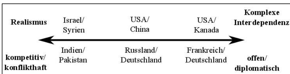
Abb. 3: Spektrum zwischen Realismus und komplexer Interdependenz