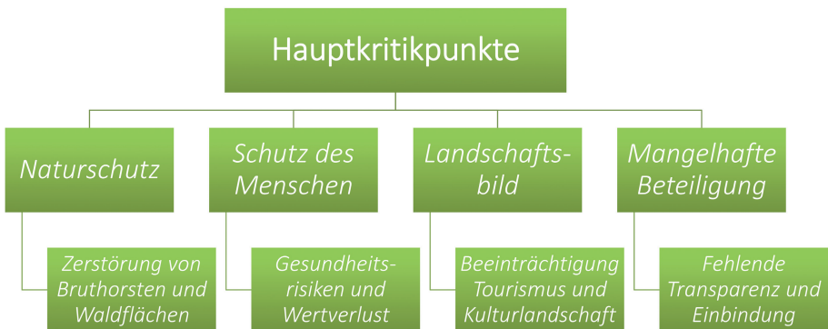
Abb. 2: Hauptkritikpunkte der Bürgerinitiative

Zudem führen der immateriell, subjektiv empfundene Einschnitt in die vorzufindende Kulturlandschaft und der materiell mittelbar befürchtete Wertverlust von Immobilien zu großem Unmut. Speziell die von WEA – bedingt durch ihre Größe – ausgehenden visuellen Beeinträchtigungen historischer Gebäude, wie touristisch genutzten Burgen, werden zum Inhalt der Protestbewegung gemacht. Dabei werden Nachteile für den sanften Tourismus befürchtet, der für den Landkreis Ahrweiler einen wichtigen Wirtschaftsfaktor darstellt (Kreis Ahrweiler 2012). Eine dynamische Betrachtungsweise von Kulturlandschaft, nach der diese einer ständigen Veränderung durch Eingriffe des Menschen unterliegt, wird abgelehnt (Interview Studienprojekt 2016). Vielmehr führt die Veränderung des Status quo durch Addition von WEA zur Annahme der teilweisen Zerstörung von Kulturlandschaft.