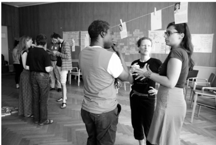
Abbildung 3: Diskussionen in einem Seminar von FairBindung

Aruns Zitat legt nahe, dass FairBindungs Bildungsarbeit zugleich Mittel und Zweck ist. Bildungsarbeit ist Mittel, um die Prinzipien einer solidarischen und gerechten Gesellschaft zu vermitteln. Sie ist aber auch Selbstzweck, weil diese Prinzipien schon in der Bildungsarbeit selbst umgesetzt werden. Die Bildungsprojekte zielen darauf ab, selbstständiges und ganzheitliches Lernen zu fördern, gemeinschaftliche Entscheidungsfindungen zu ermöglichen und die Selbstreflexion der Teilnehmer*innen zu stärken. Auch die Selbstbestimmung der Referent*innen soll möglichst umfassend gewahrt bleiben, indem sie Themen und Methoden, die und mit denen sie vermitteln wollen, weitestgehend selbst setzen. Partizipation und Selbstbestimmung sind daher die leitenden Werte der Bildungsarbeit.