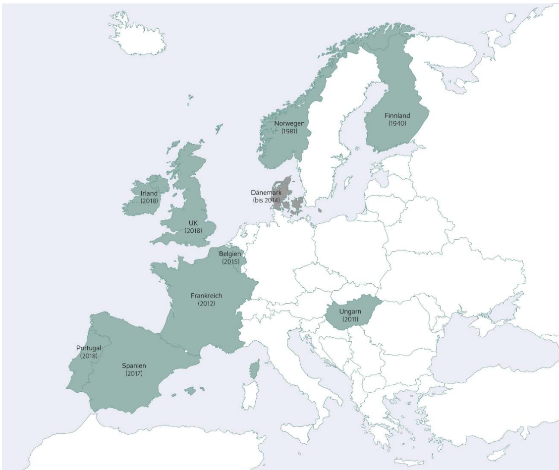
Abbildung 1: Länder Europas, die eine Softdrinksteuer erheben oder erhoben haben Jahr der Einführung bzw. Absetzung in Klammern