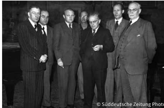
Wirtschaftsbesprechung der amerikanischen und britischen Zone 1946