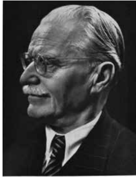
Adolf Weber 29. 12. 1876 – 5. 1. 1963

Quelle: Jahrbuch der Bayerischen Akademie der Wissenschaften 1964.