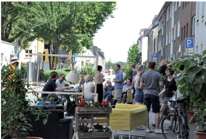
Abb. 3: Urbane Intervention „Urban Living Room“ in Essen – vorher/nachher