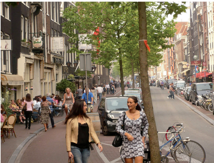
Abb. 1: Autoorientierter Straßenraum versus menschenorientierter Straßenraum