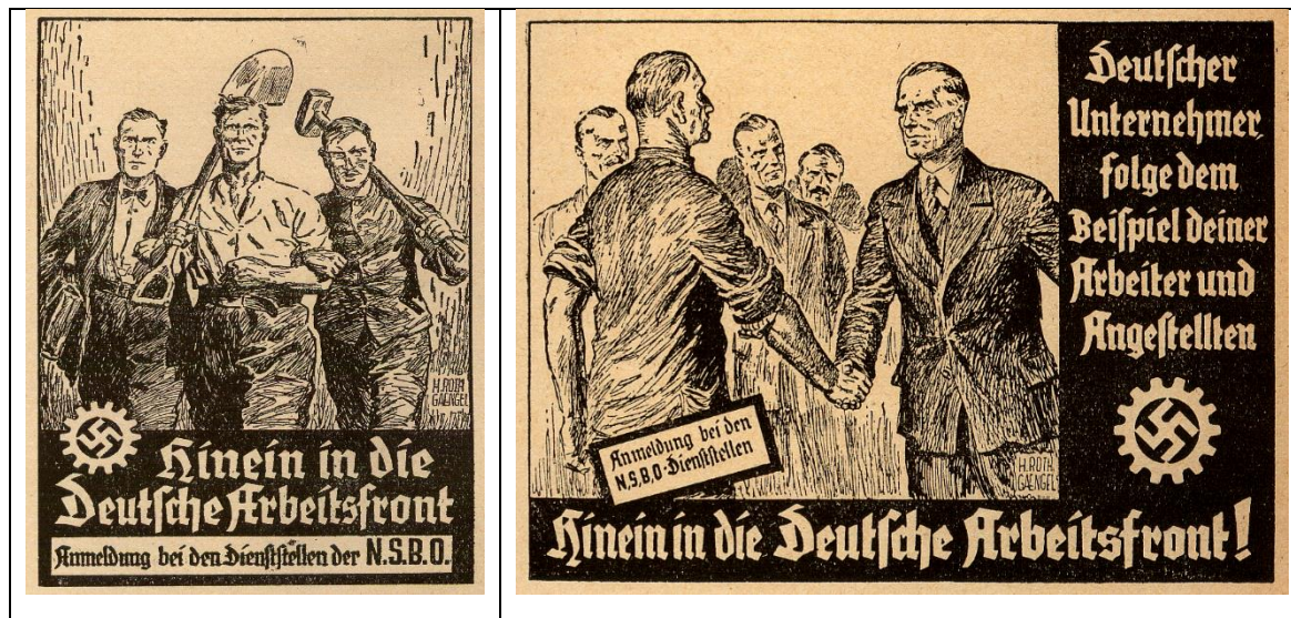
Abb. 2: Anzeigen der Deutschen Arbeitsfront,

Quelle: Blätter für Genossenschaftswesen , 81. Jg. (1934), S. 287 und 301