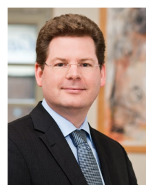
Professor Dr. Oliver Holtemöller

und liegt damit deutlich über dem durchschnittlichen Zollsatz, den die USA auf Importe erheben (3,5%). Die EU-Zollpolitik ist somit insgesamt protektionistischer als die Zollpolitik der USA. Wenn die Produktklassen mit ihren unterschiedlichen Importwerten gewichtet werden, fällt der Unterschied etwas geringer aus (3,0% versus 2,4%).