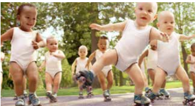
Abbildung 3: Evian Webespot "Roller Babies"

K 1 Authentizität ✨ Glaubwürdig ist dieser Spot eher nicht, allerdings fasziniert er den Zuschauer und überzeugt mit gekonnter Animation der Agentur BETC. Wäre diese ein Archetyp, dann ganz klar ein „Schöpfer“, so erfolgreich und