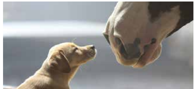
Abbildung 4: Budweiser Werbespot "Puppy Love"

K1: Authentizität ✨ Authentizität erhält dieser Spot aufgrund der außergewöhnlichen, warmherzigen Freundschaft zwischen einem Pferd und einem Welpen. Der Markenname allein verrät schon den Archetypus der hinter dieser Freundschaft steckt, nämlich der „Durchschnittstyp“, auf Englisch: "Bud(dy)"-weiser.