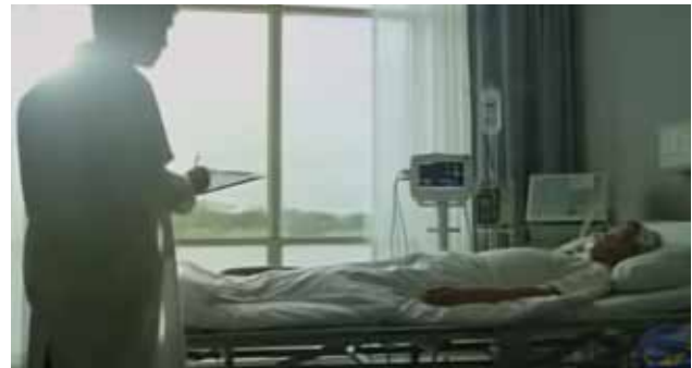
Abbildung 4: Thai Life Insurance Werbespot

vor 30 Jahren geholfen hat, nun sein behandelnder Arzt ist. Allerdings lädt dies den Zuschauer