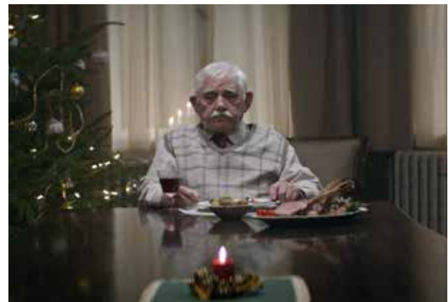
Abbildung 2: Edeka Werbespot "Heimkommen"

Der Werbespot handelt von einem einsamen Opa, der Jahr für Jahr vergeblich darauf hofft, mit seinen Kindern und Enkelkindern Weihnachten feiern zu können (Edeka 2015). Diese sagen jedoch jedes Jahr erneut ab und er verbringt Weihnachten alleine, bis er zu einer drastischen Maßnahme greift. Er täuscht seinen Tod vor. Daraufhin lassen die (Enkel-)Kinder alles stehen und liegen und reisen sofort aus aller Welt in ihre Heimat. Als sie in ihrem Elternhaus ankommen, erwartet sie ein gedeckter Tisch und ihr Vater/Opa kommt mit der Frage „Wie hätte ich euch denn sonst alle