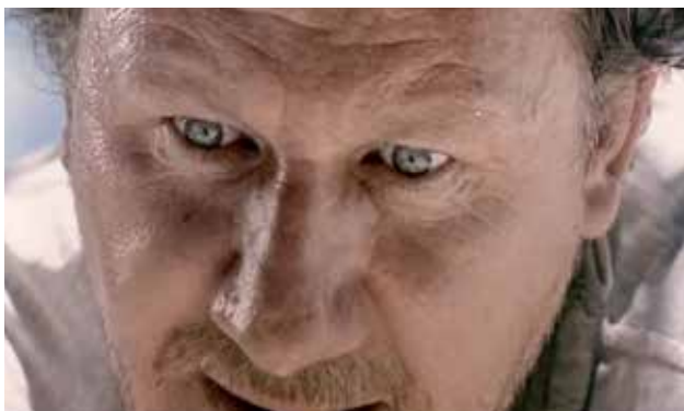
Abbildung 2: Hornbach Werbespot #HornbachHammer

Im Werbespot hält ein Mann mit Halbglatze eine Rede vor anderen Männern mit ähnlichem Haarwuchs: „Spürst Du nicht die Schönheit dieser Linie? [...] Nein, da fehlt nichts. Euch ist etwas gewachsen!“