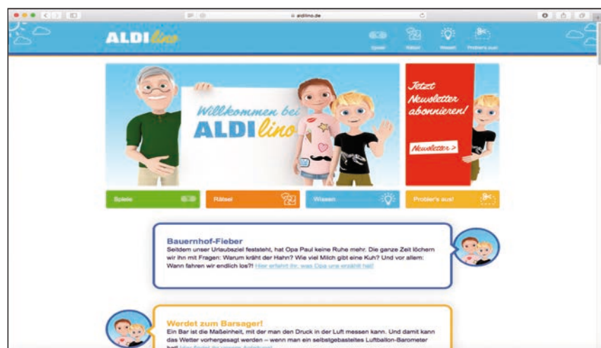
Abbildung 1: Website ALDIlino.de

K 6 : ALDIlino präsentiert sich gegenüber Erziehungsberechtigten als sichere Website und spricht Kinder