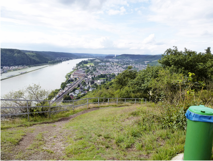
Abb. 5: Blick ins Mittelrheintal in Richtung Bonn

Regelmäßig werden auch Natur- und Artenschutz als Gegenargumente zu den Windkraftplänen vorgebracht. Wald müsse gerodet, Beton verbaut werden, „Natur- und Artenschutz sind bedroht“ (RZ-2013-05-28). Vögel, Fledermäuse, ‚schützenswerte Tiere‘, die ‚bedrohte Gelbbauchunke‘, Flora und Fauna werden angeführt, die Windkraftanlagen zum Opfer fallen könnten (u. a. RZ-2013-09-07, RZ-2013-09-11, RZ-2015-08-19, RZ-2015-12-04). Auch die Bürgerinitiativen fürchten Auswirkungen wie das Vertreiben der „geschützte[n] Wildkatze“ und „viele[r] Zugvögel wie Wildgänse und Kraniche“ sowie „tiefgreifende[ ] Beeinträchtigungen der Wald-Ökologie“ (BINPRW). Windkraftanlagen und Natur- und Artenschutz schließen sich entsprechend dieser Argumentationsmuster aus. Nach derzeitigem Stand sind es wiederum gerade naturschutzfachliche Belange, die den Bau von Windkraftanlagen als unwahrscheinlich erscheinen lassen: Nach Ergebnissen mehrerer Gutachten „sieht es so aus, als hätten Uhu, Schwarzstorch und Co. die Windparkpläne am Asberg gewaltig durchkreuzt“ (RZ-2014-07-12).