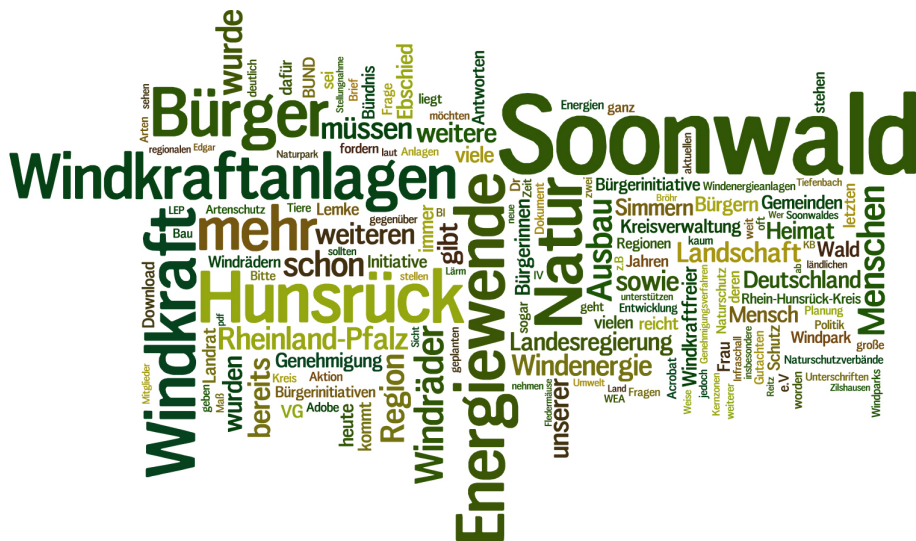
Abb. 3: Hochfrequente Worte innerhalb der Websites der Bürgerinitiativen im Kontext des Naturparks Soonwald-Nahe / Quelle: Eigene Darstellung

pelt und gehören zum Vertrauten, wozu Windräder nicht passen, die entsprechend dieser Argumentation abgelehnt werden (hierzu auch Narrationen in Textbox 2, Hervorhebungen durch die Verfasser).