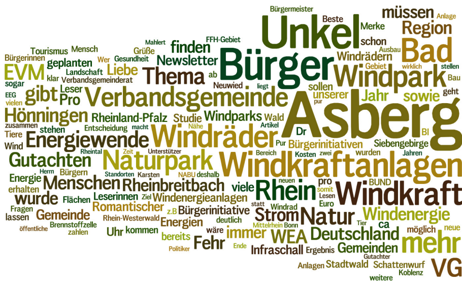
Abb. 6: Hochfrequente Worte innerhalb der Websites der Bürgerinitiativen im Kontext des Naturparks Rhein-Westerwald

Auffällig ist zunächst, dass zwei Bürgerinitiativen im Titel aktiv auf den Naturpark rekurrieren, zum einen die Bürgerinitiative Pro Naturpark Pur , zum anderen die Bürgerinitiative Naturpark leben zwischen Rhein und Wied . Der Naturpark wird zu einer regionalen, räumlichen Bezugsgröße. Sowohl in den Artikeln der Rhein-Zeitung als auch auf den Websites der Initiativen wird der Naturpark regelmäßig angeführt und auf Auswirkungen auf diesen verwiesen. Die diskursive Verankerung von ‚Naturpark‘ zeigt sich auch bei einer graphischen Darstellung hochfrequenter Worte innerhalb der Bürgerinitiativen-Websites, bei denen ‚Naturpark‘ hinter ‚Asberg‘, ‚Unkel‘, ‚Bürger‘, ‚Windkraft‘, ‚Windräder‘, ‚Windkraftanlagen‘ in der Größendarstellung liegt – und damit noch vor ‚Energiewende‘ oder ‚Region‘ (Abb. 6).