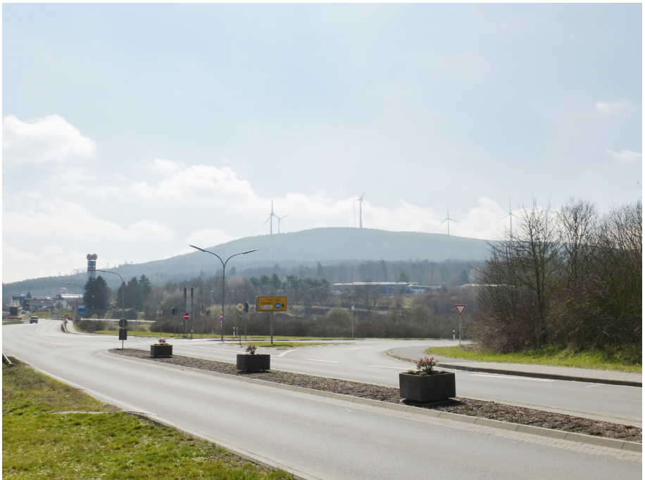
Abb. 4: Blick von Rheinböllen aus (an der A 61) auf Windräder innerhalb des Naturparks Soonwald-Nahe

verbundenen Einschränkungen zur Errichtung von Windkraftanlagen“ verknüpft (RZ-2014-03-05, auch BI-NPSN). Die Kernzonen im Naturpark Soonwald-Nahe wurden erst Mitte 2014 offiziell rechtsverbindlich ausgewiesen (Gesetz- und Verordnungsblatt für das Land Rheinland-Pfalz 2014), womit deren potenzielle Preisgabe kurze Zeit später auf Ablehnung beziehungsweise Kritik stößt. Die Bürgerinitiativen lehnen die „Preisgabe der Naturpark-Kernzonen“ (B-EMN) beziehungsweise „eine Öffnung für Windkraft in Kernzonen“ ab (RZ-2013-01-06). Die „Kernzonen von Naturparks“ beziehungsweise „die Kernzonen des Naturparks“ Soonwald-Nahe sollten als Ausschlussgebiete festgelegt werden (BI-NPSN). Für die Initiativen schließen sich Kernzonen und Windkraftnutzung aus.