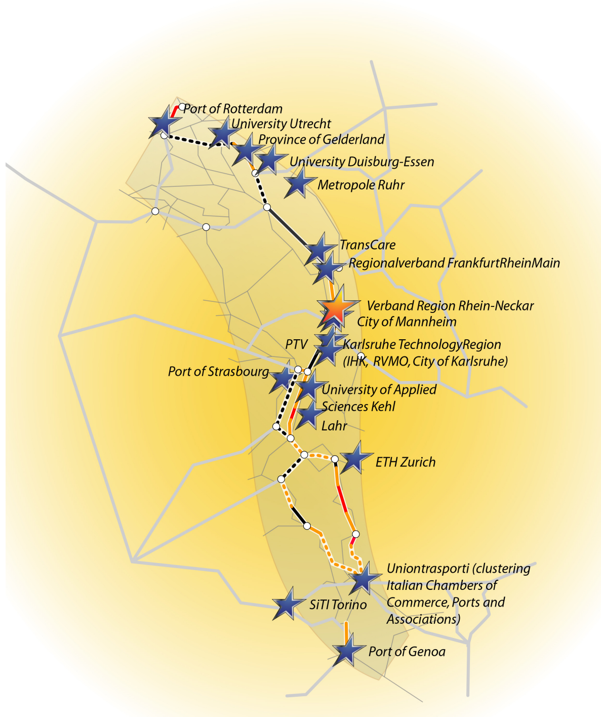
Abb. 1: Sitz der Projektpartner von CODE24