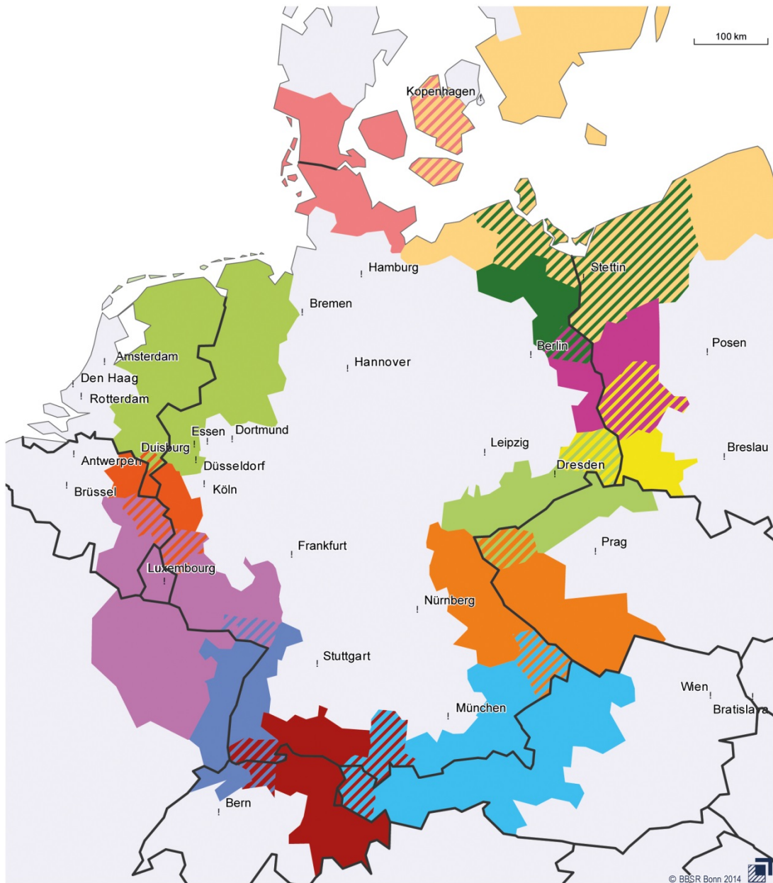
Abb. 2: INTERREG V A (Grenzüberschreitende Zusammenarbeit) – Beteiligung in Deutschland 3