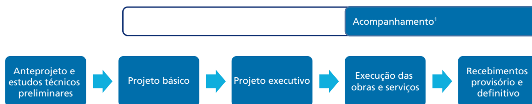
FIGURA 2 Macrofases de execução de obras públicas a partir das leis n os 8.666/1993 e 12.462/2011

A Lei de Licitações foi especialmente criada para dar maior transparência, economicidade e impessoalidade às contratações de obras públicas. Após dezoito anos, a realização de grandes eventos no país e as dificuldades para a execução de obras públicas levaram à criação do RDC, para dar principalmente maior agilidade a estas iniciativas. A Lei de Licitações e o RDC estabelecem procedimentos para a utilização dos recursos públicos, os quais permitem identificar macroetapas para o gerenciamento das obras públicas, apresentadas esquematicamente na figura 2.